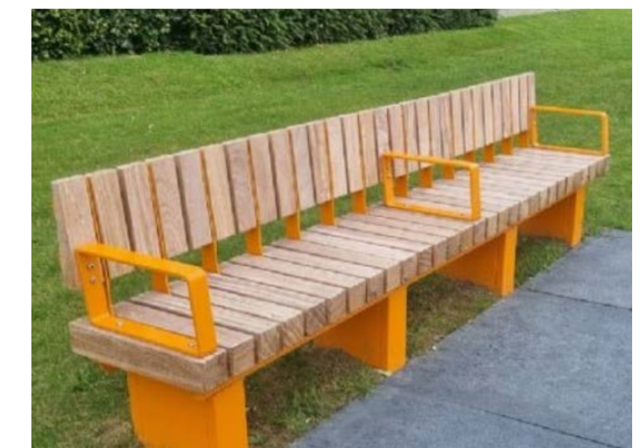
Bankjes en picknickbankjes