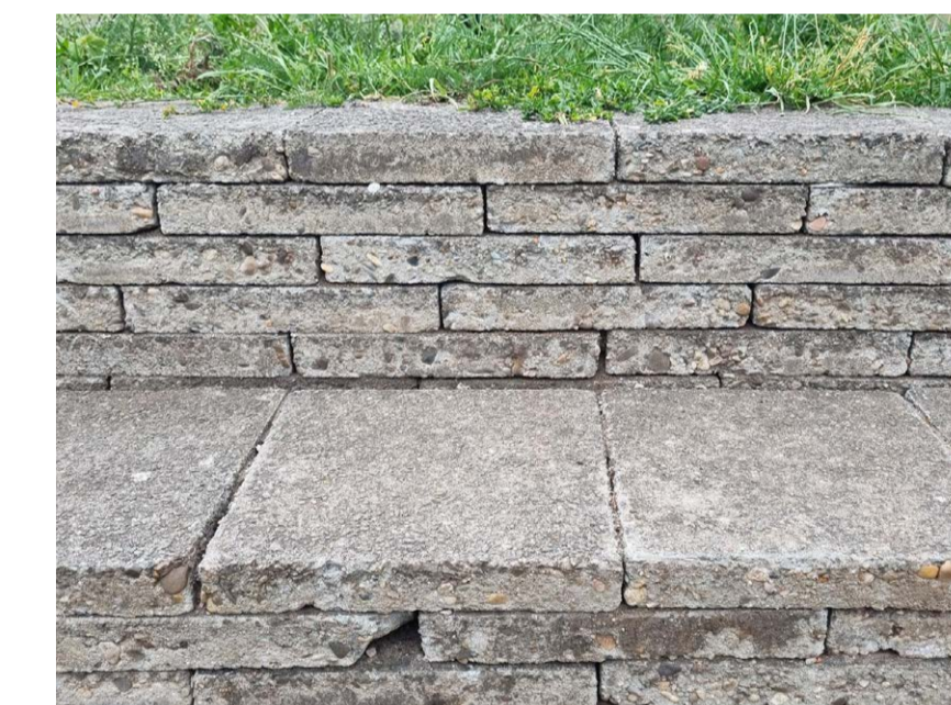
Muurtje oude stoeptegels