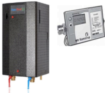
Figuur 2: afleverset

Figuur 1: een vergelijking van de diktes van de hoofdleiding (bovenaan), distributieleiding (midden) en de woonhuisaansluiting (onderaan). De werkelijke uitwendige en inwendige diameters zijn: hoofdleiding: 45 cm en 30 cm, distributieleiding: 14 cm en 6,5 cm, woonhuisaansluiting: 9 cm en 2,5 cm. Het verschil tussen de uitwendige en inwendige diameter is de isolatielaag die om de binnenbuis zit.